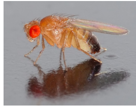
(Bild zeigt eine Drosophila melanogaster )

Um die Chill-Coma Recovery Time (CCRT) der europäischen Drosophila melanogaster mit der taiwanesischen Population zu vergleichen, werden Drosophila melanogaster an jeweils 10 verschiedenen Orten in Frankreich, Spanien und Italien gesampelt.[4mm] Keine repräsentative Stichprobe! [4mm] Die CCRT von Fruchtfliegen in Südeuropa ist nicht typisch für die CCRT europäischer Fruchtfliegen.